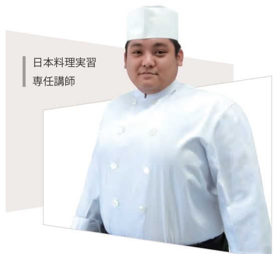
日本料理実習 専任講師

日本語講習は下記条件に該当する者が務めます 四年制大学卒業かつ以下のいずれかを満たす者 ①日本語能力検定合格者 ②日本語教師養成講座420時間を終了 ③大学・大学院で日本語主専攻 or 副専攻修了者